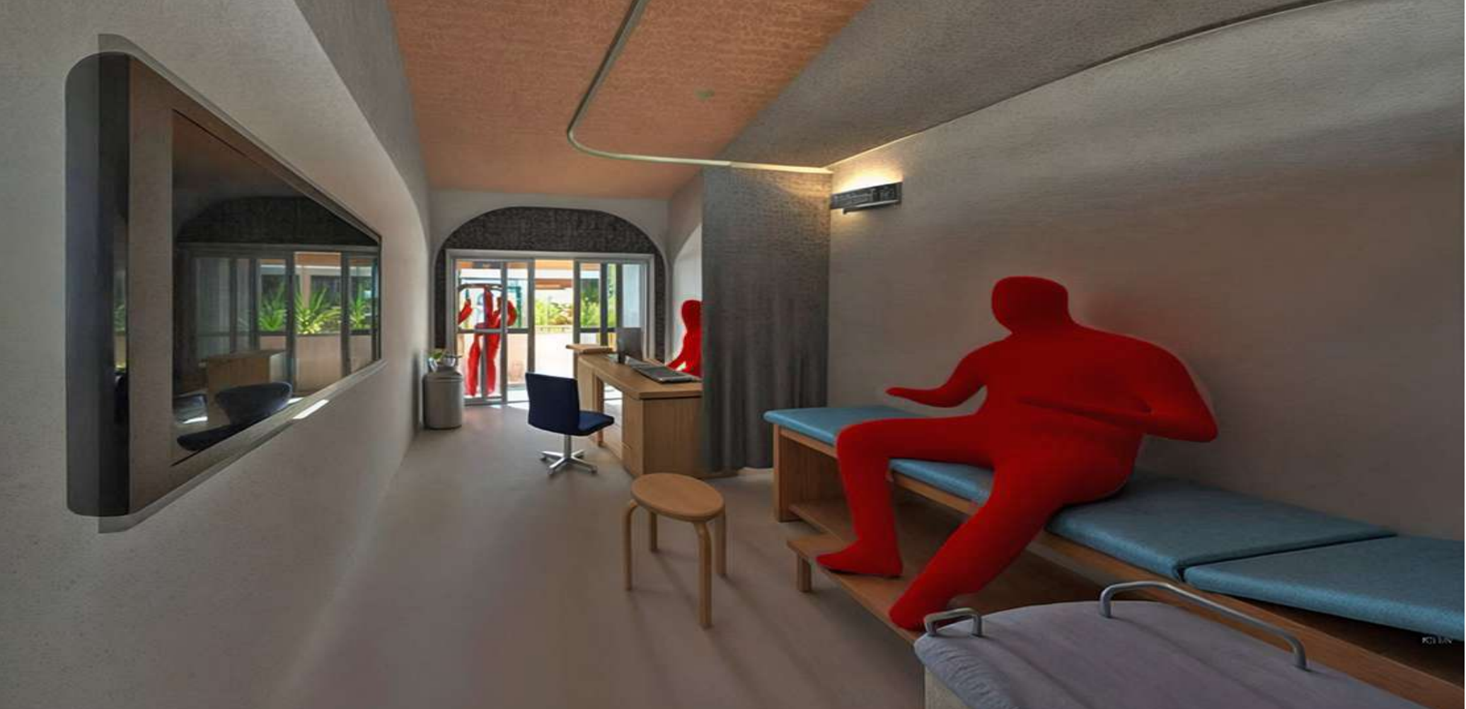
RENDER PEATON CONSULTORIO TIPO