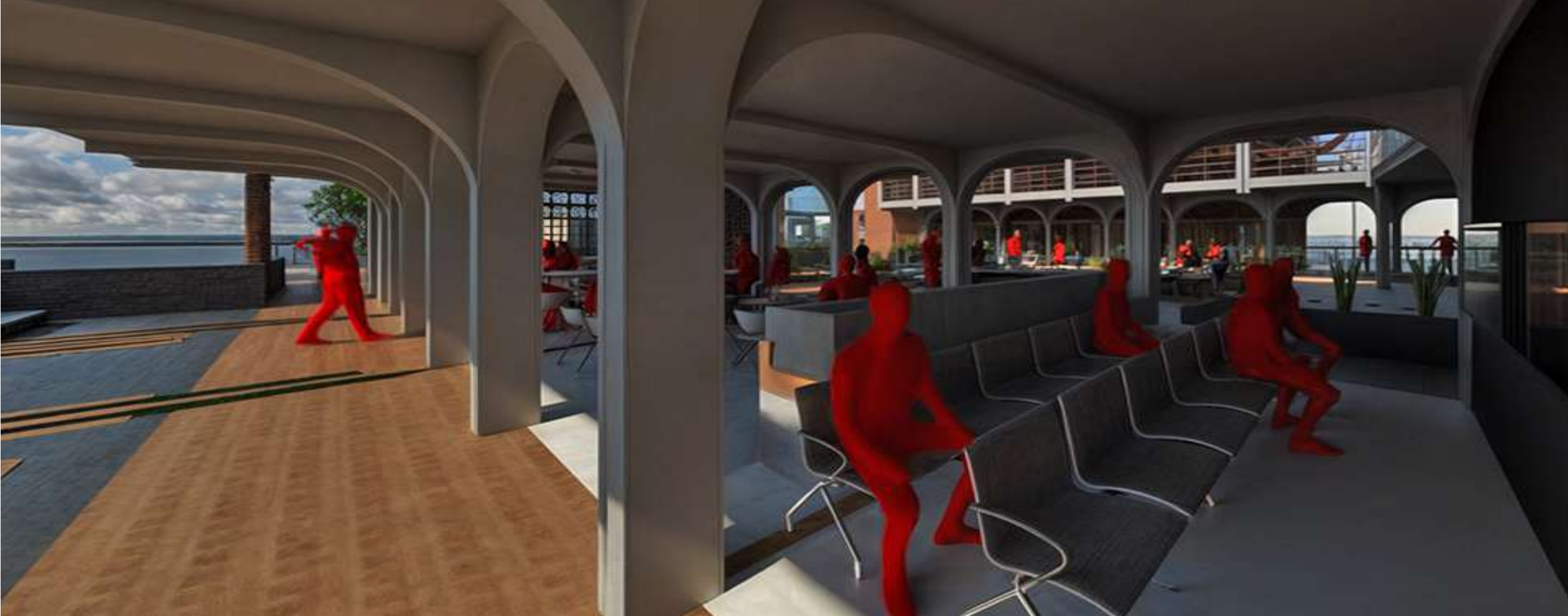
RENDER PEATON PLANTA LIBRE TORRE 2