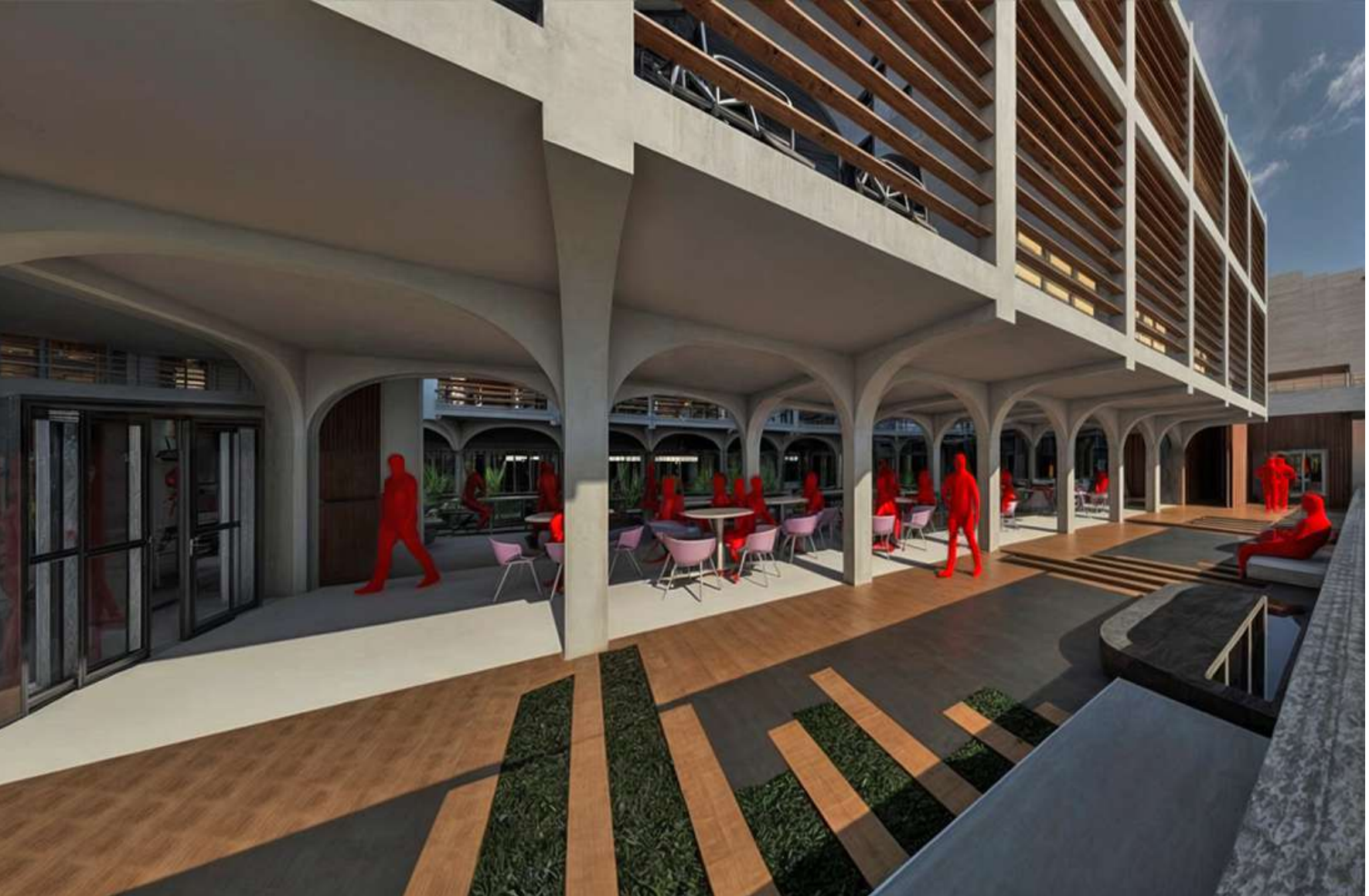
RENDER PEATON PLANTA LIBRE TORRE 2