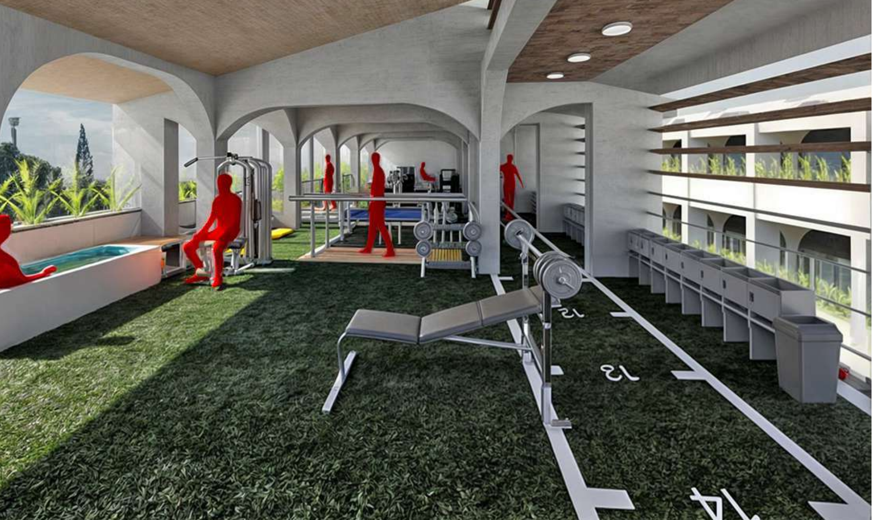
RENDER PEATON PLANTA 3 TORRE 1 (REAHABILITACION)