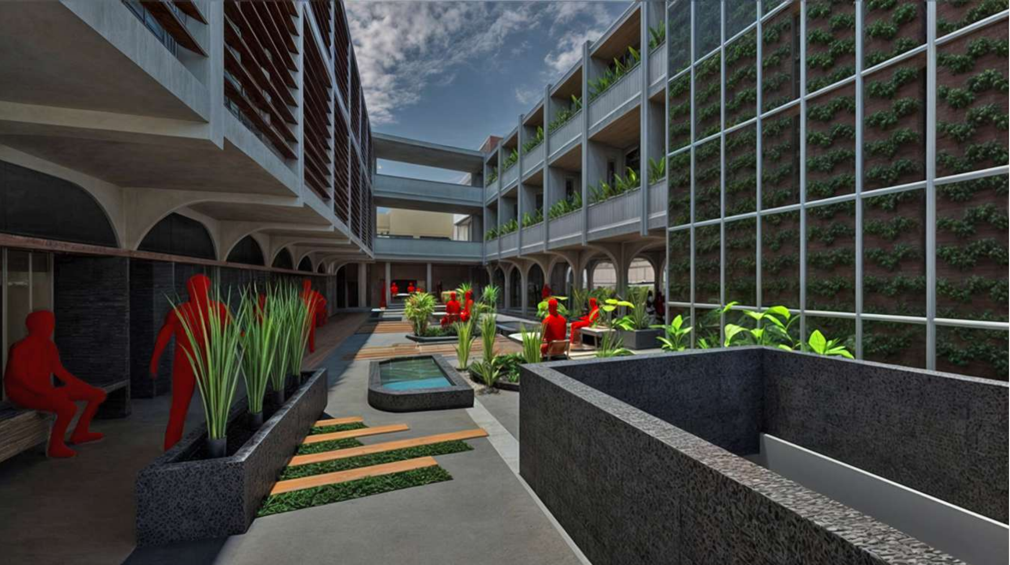
RENDER PEATON PATIO INTERNO