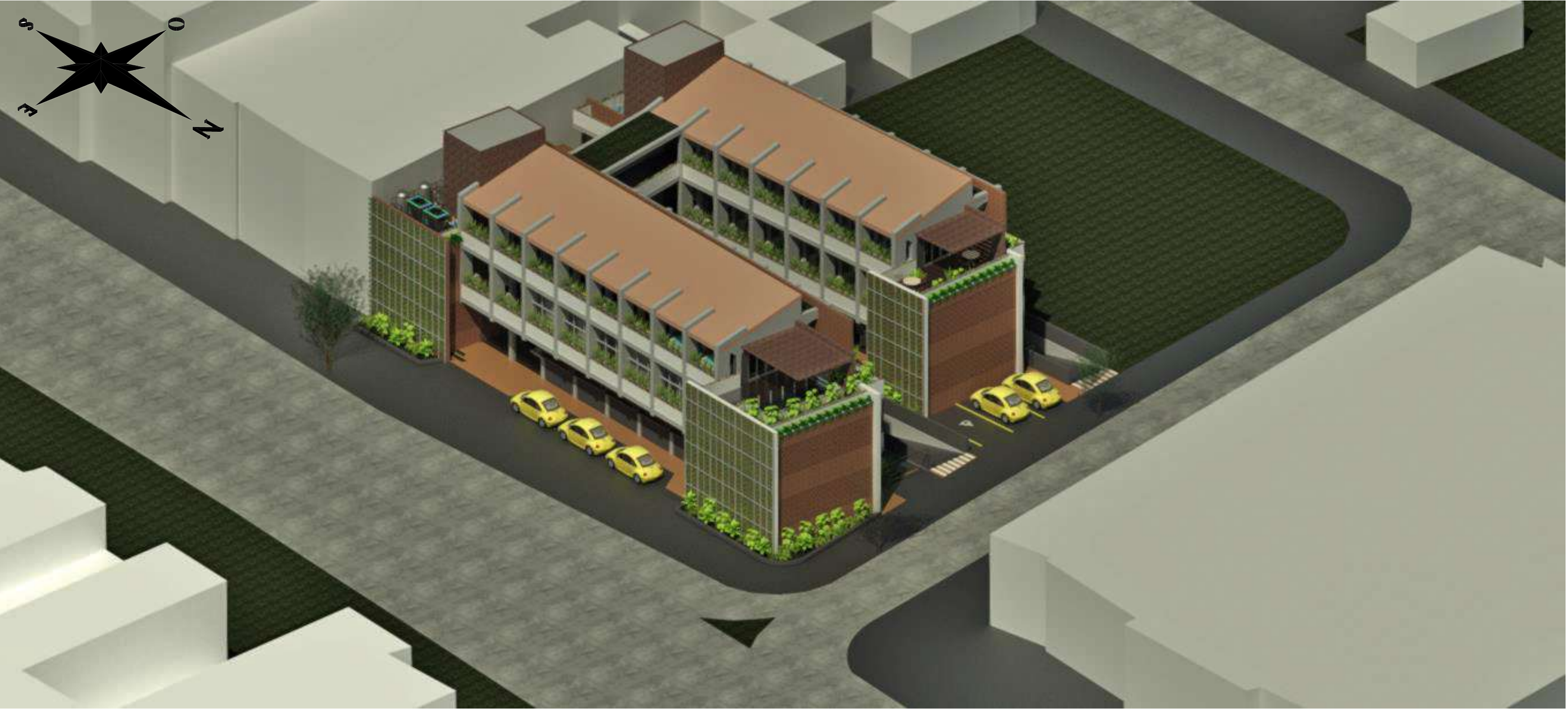
RENDER AEREO ESTE / NORTE