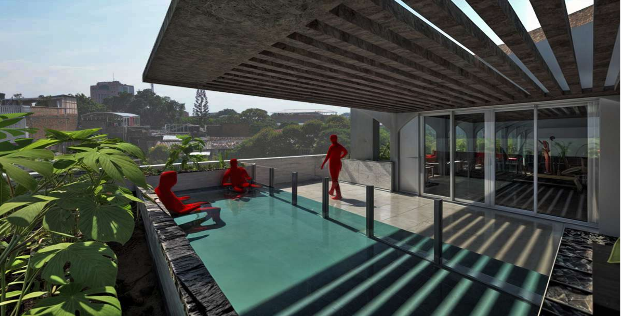
RENDER PEATON TERRAZA TORRE 1 (REAHABILITACION CRIOTERAPIA)