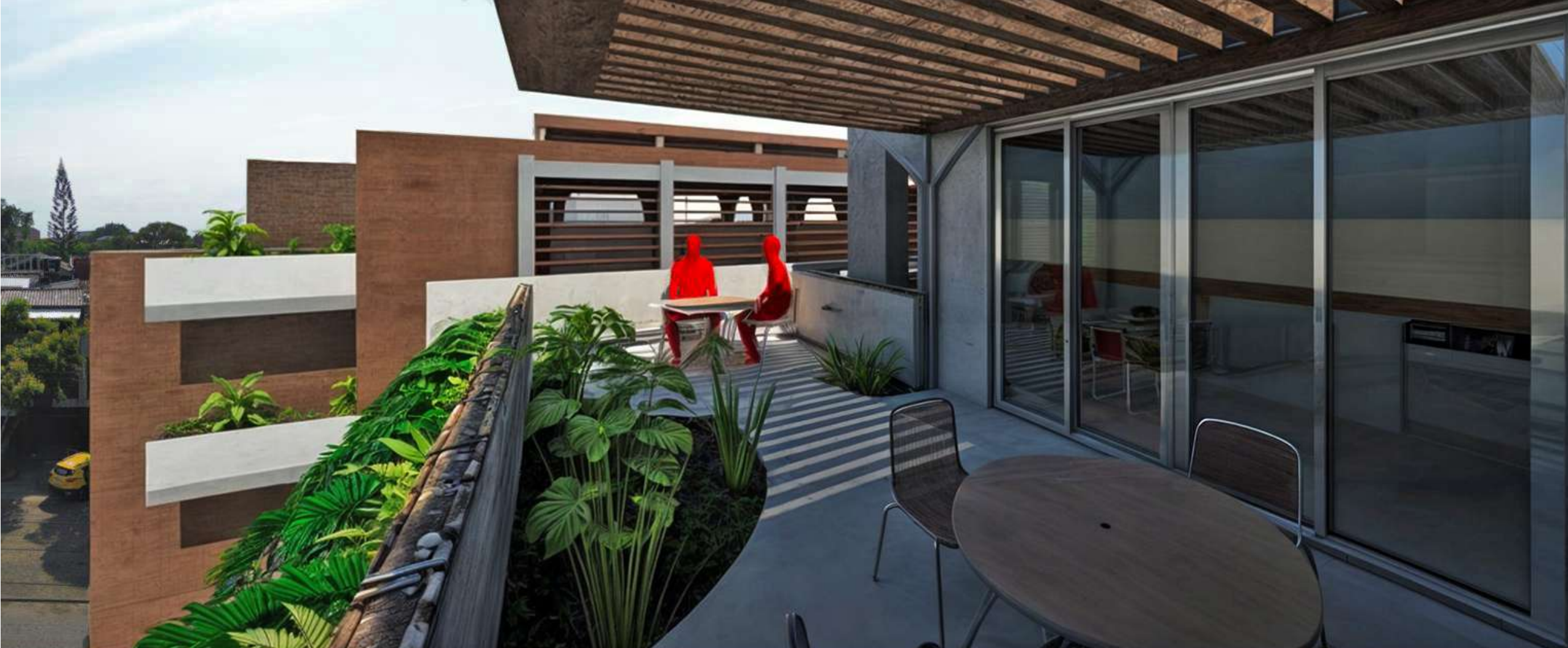
RENDER PEATON TERRAZA TORRE 2