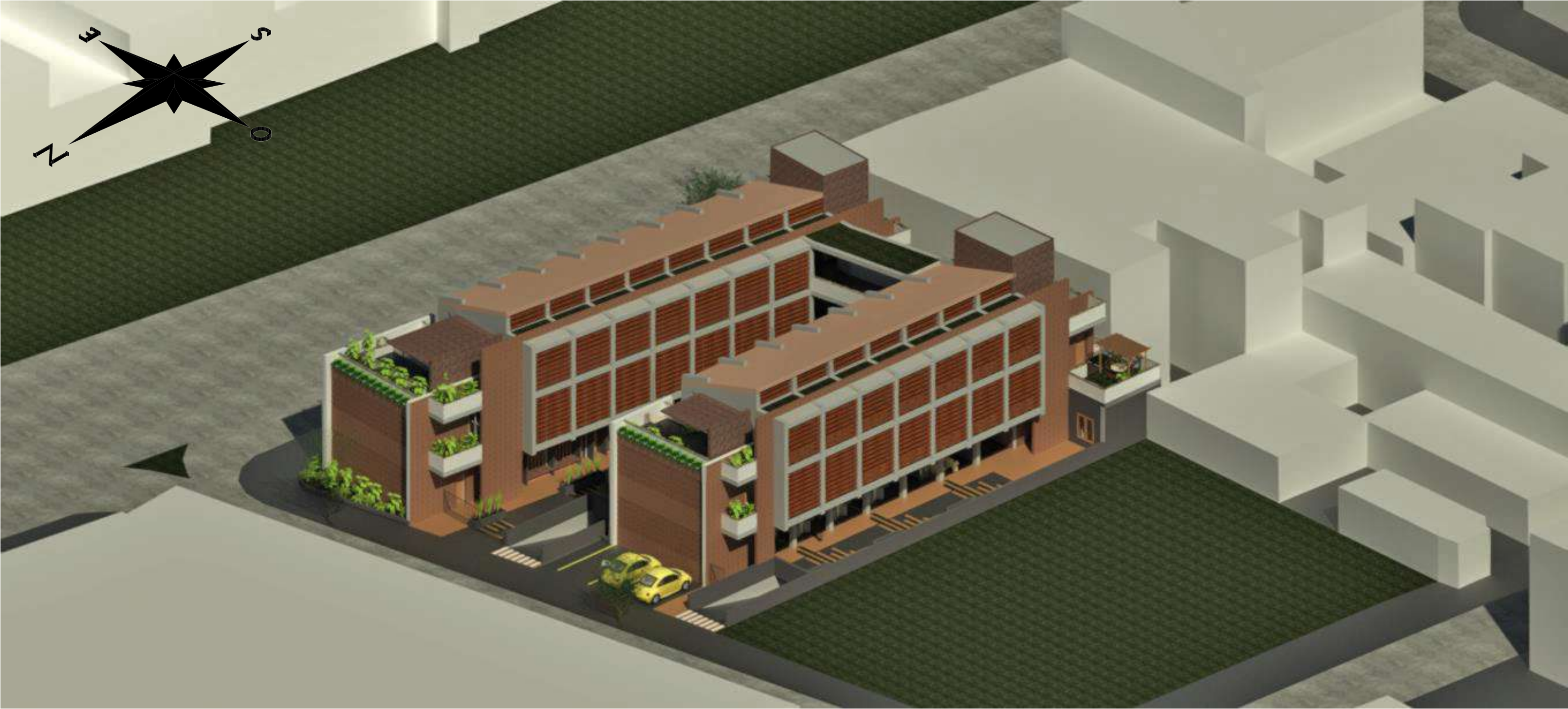
RENDER AEREO NORTE / OESTE